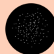
bola de sangre