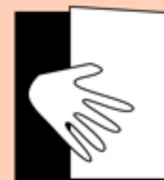
como es arriba es abajo